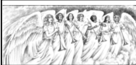
NELLA CASA DEL PADRE

ABI: 07601 CAB: 14700 Codice IBAN: IT35 W076 0114 7000 0001 0252 047