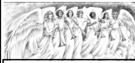
NELLA CASA DEL PADRE