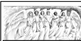
NELLA CASA DEL PADRE

Con questa terza domenica di Avvento (detta 'Della gioia') comincia la fase più intensa di preparazione al Natale. Gli appuntamenti della Novena prevedono, oltre alla messa vespertina delle 18, la recita comunitaria delle Lodi mattutine ogni giorno alle 7,30 in chiesa; domani, inoltre, alle 20,30 , presso Casa Betlemme ci sarà un incontro di approfondimento sul Natale ; sarà con noi don Paolo Spaviero, giovane parroco a Sezze, ed esperto di teologia morale. Mercoledì , infine, alle ore 20,30 , viene offerta a tutti, adulti, giovani e ragazzi fino al II anno di Cresima, la possibilità di accostarsi al sacramento della confessione grazie ad una liturgia penitenziale durante la quale saranno disponibili vari sacerdoti.