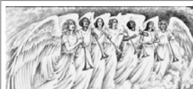
NELLA CASA DEL PADRE