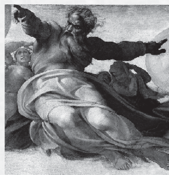
Dio Padre e Giudice negli scritti del Nuovo Testamento e dei Padri apostolici Mercoledì 14 ottobre 2015

Ogni lezione verterà su un autore e un periodo specifico, privilegiando un approccio di natura didattico-conoscitiva e segnalando spunti per eventuali attività interdisciplinari.