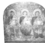
Alfresco della Ss. Trinità (sec. XII)