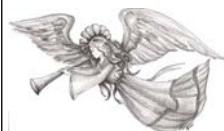
NELLA CASA DEL PADRE

In settimana sarà portata la Comunione alle persone malate o impossibilitate per gravi motivi a partecipare alla messa domenicale.