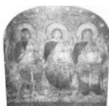
Alfresco della SS. Trinità (sec. XII)